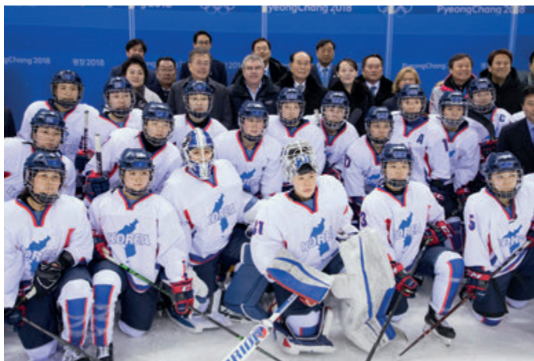
Wspólna reprezentacja kobiet w hokeju na lodzie wraz z prezydentami Korei Północnej i Południowej w Pjongczangu w 2018 roku

With the Presidents of North and South Korea and the joint women's ice hockey team Pyeongchang 2018