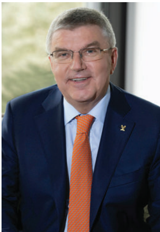
Doktor Thomas Bach