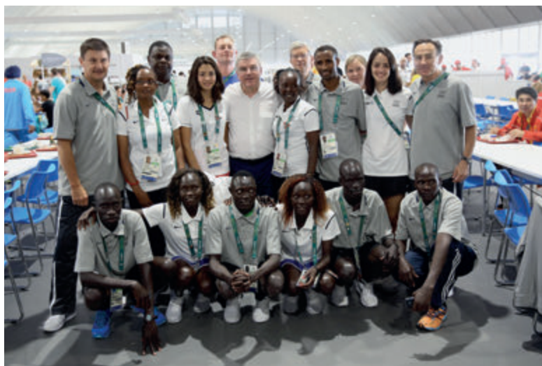
Drużyna uchodźców MKOl w Rio de Janeiro w 2016 roku IOC Refugee Olympic Team Rio de Janeiro 2016