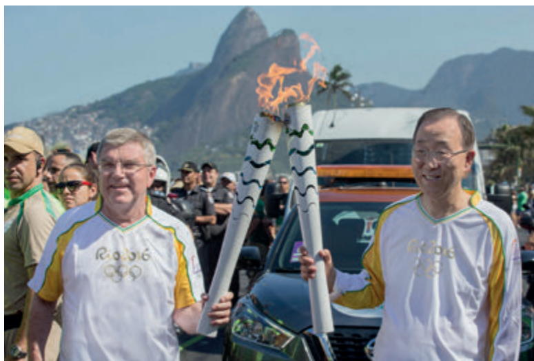
Sztafeta z ogniem olimpijskim wraz z Sekretarzem Generalnym ONZ Ban Ki-moonem w 2016 roku Torch relay 2016 with the UN Secretary-General Ban Ki-moon