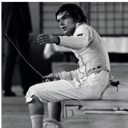
Thomas Bach – mistrz świata i reprezentant sportowców Thomas Bach – world champion and athletes' representative