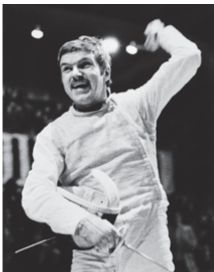
Mistrz olimpijski Olympic champion