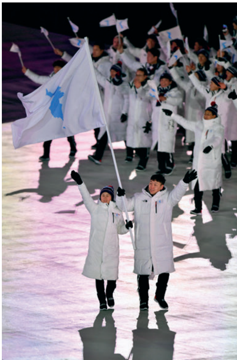
Wspólny przemarsz reprezentacji Korei Północnej i Południowej w Pjongczangu w 2018 roku

Joint march of North and South Korea at Pyeongchang 2018