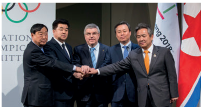
Ogłoszenie decyzji o wspólnych działaniach obu narodowych komitetów olimpijskich i rządów Korei Północnej i Południowej podczas XXIII Zimowych Igrzysk Olimpijskich w Pjongczangu w 2018 roku

With the Presidents of North and South Korea and the joint women's ice hockey team Pyeongchang 2018