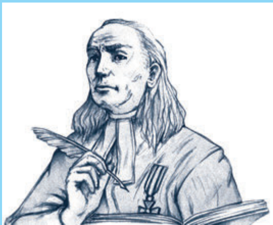
Il. 3. Krzysztof Celestyn Mrongowiusz