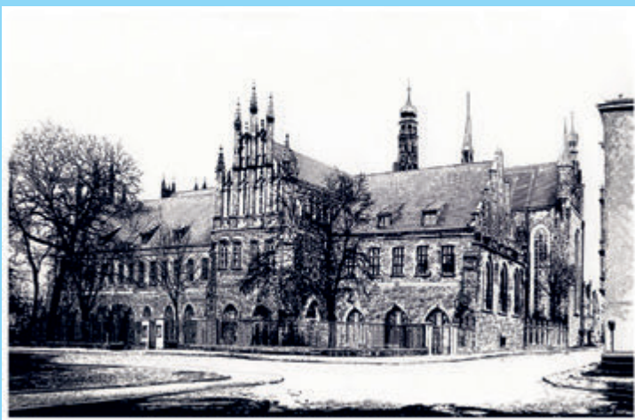
Il. 1. Budynek Gdańskiego Gimnazjum Akademickiego